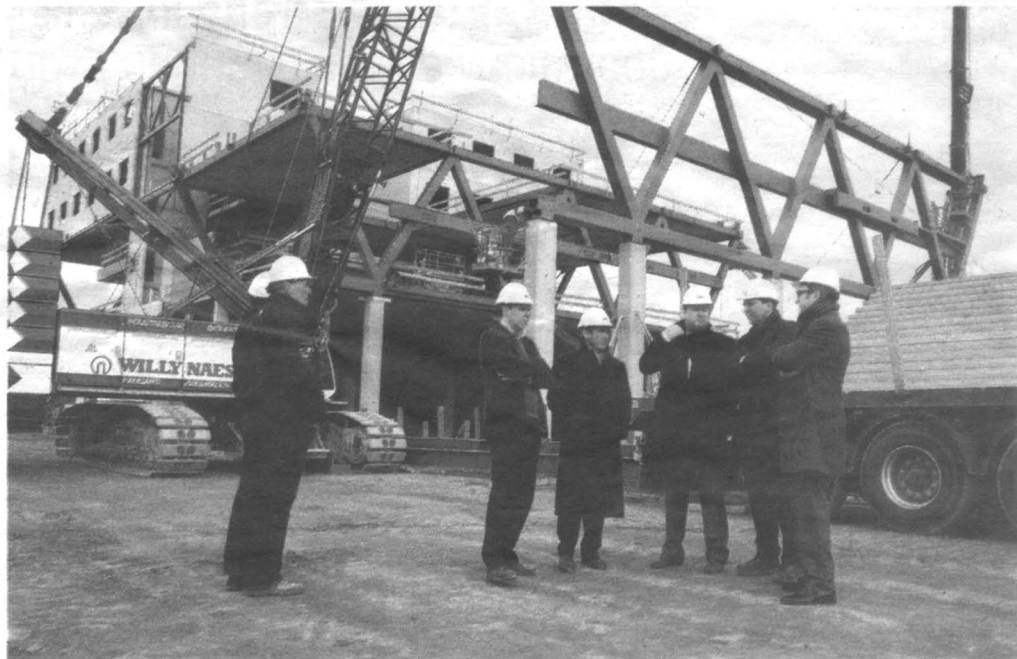
Het bedrijvencomplex staat nu nog in de steigers.

Het Herentalse bedrijf Drisag wordt een van de hoofdgebruik-